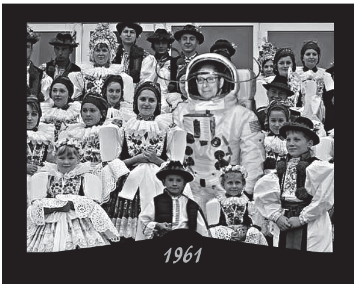
Známa momentka, na níž se Garfinkel druží s domorodci v místní hospodě. Fotografie byla publikována se svolením jejího autora, majitele Slováckého dvora.

Edmund Husserl by si nikdy nebyl sto představit, jakého pokroku dosáhne jeho koncept přirozeného světa díky Garfinkelově usilovné práci v Ostrožské Nové Vsi. Alfred Schutz sice už dříve Husserlův filosofický koncept obrátil sociologicky z hlavy na nohy, ale Garfinkelovy inovace znamenaly obrovský průlom v možnostech empirického etnografického nakládání s přirozeným světem lidské každodennosti a s vykazováním etnometodologických analýz.